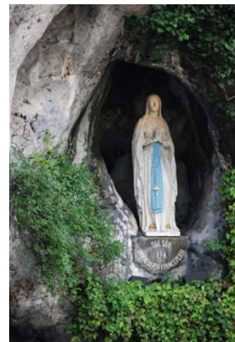
La Gruta en Lourdes

eligió a Lourdes para hacer su aparición, pero sabemos que el hecho de que ella lo hizo es significativo y así lo afirma la Iglesia al reservar el 11 de Febrero como el Día de Nuestra Señora de Lourdes. Aquí en el Santuario de San Judas, tendremos nuestra Novena anual en honor a Nuestra Señora de Lourdes , del 3 al 11 de Febrero. Y como hemos hecho en los dos últimos años, también tendremos nuestro Retiro