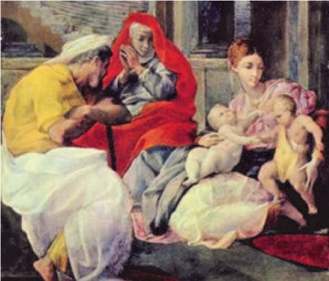
Sagrada Familia con Santa Elizabeth por Pellegrino Tibaldi (1527-1596, Milán), Museo del Ermitage, San Petersburgo.