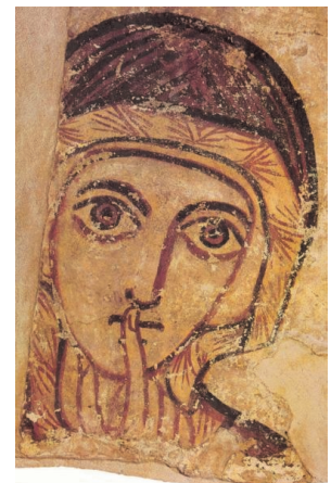
Fresco de Santa Ana, Museo Nacional, Warsaw. Siglo VIII