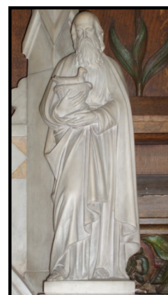
San Joaquín en la Capilla de la Virgen, Iglesia de Santo Domingo, SF, CA.