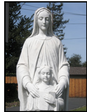
Santa Ana con María en la Iglesia de San Simón, Los Altos, CA.

Bondadosa Santa Ana, he alcanzado el fin de esta novena en tu honor. Te he pedido y te pido otra vez más. Madre buena, no permitas que tu oído amable se cansé de mis oraciones y ruegos, a pesar de que los repito tan a menudo. Excelentísima Señora, suplica por mí a la divina Providencia, por toda la ayuda que necesito a lo largo de la vida. Que tu mano generosa me conceda los medios materiales para satisfacer mis propias necesidades y para aliviar el apuro de los pobres. Piadosa Santa Ana, a la hora de mi muerte, fortifícame en los sacramentos de la Iglesia. Permíteme entrar a acompañar a los Santos en el reino de los cielos, donde podré alabar y dar gracias a la Santísima Trinidad, tu gloriosa hija María, y a ti misma, queridísima Santa Ana, hasta el infinito. Amen.