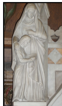
Santa Ana y María, en la Capilla de la Virgen, Iglesia de Santo Domingo, SF, CA.

los santos pueda alabarle y bendecirle a Él por toda la eternidad. Amén.