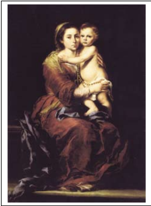
Portada de la Tarjeta (Medidas: 4.5" x 6.25")