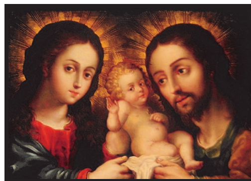
Nicolás Rodríguez Juárez (Mexico, 1667-1734)